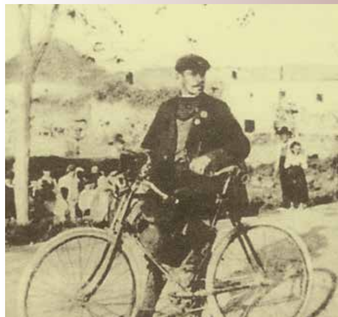
Budicki na jednom od svojih biciklističkih pohoda